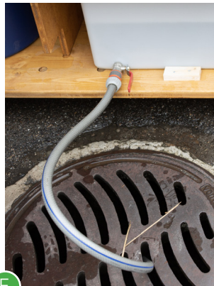
F Anderes Schlauchende in die Kanalisation leiten, roten Hebel nach unten drehen und Urin ablaufen lassen.