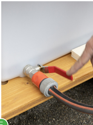
E Roten Hebel nach unten drehen.