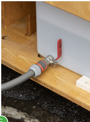
E Schlauch mit Gardena-Adapter an den Urintank anschliessen.