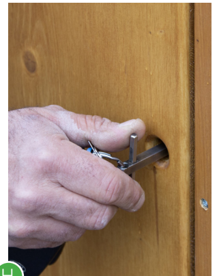
H Klappe und Wartungsraum wieder schliessen und Kabine wieder öffnen.