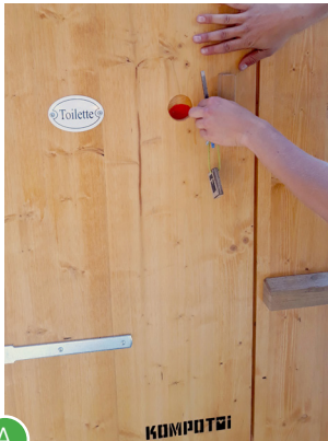
A Urinstand regelmässig kontrollieren. Zum Leeren wie folgt vorgehen: Kabine abschliessen.

... direkt in die Kanalisation (ohne Pumpe)