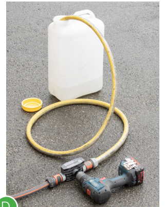
D Pumpe (z.B. Bohrmaschinenpumpe) verbinden und Schlauchende in den Zwischenbehälter legen.