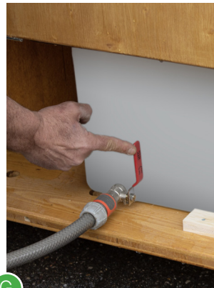
G Wenn der Urintank leer ist, roten Hebel zum schliessen wieder nach oben drehen und Schlauch abhängen.