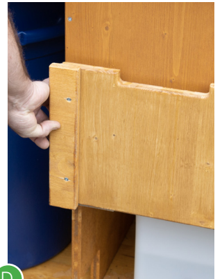
D Klappe für den Urintank öffnen.