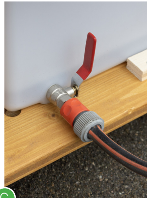
C Schlauch mit Gardena-Adapter an den Urintank anschliessen.