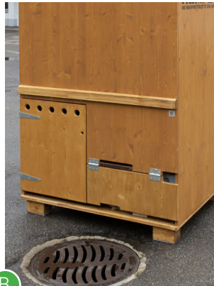
B Anschluss an Kanalisation finden.