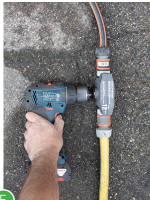
F Urin mit der Pumpe abpumpen.